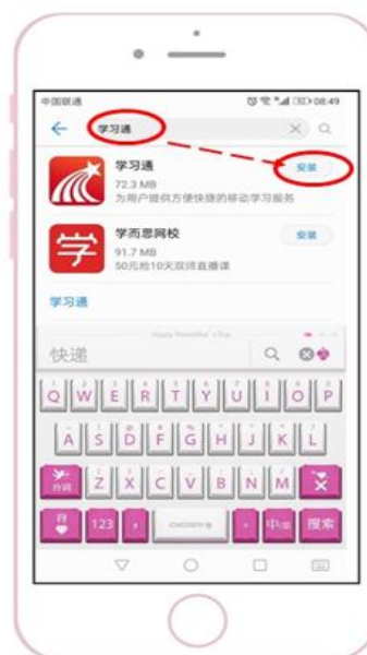
安卓手机 应用市场搜索下载