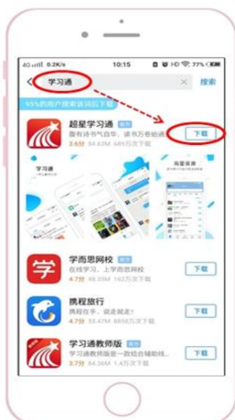
苹果手机 Appstore搜索下载